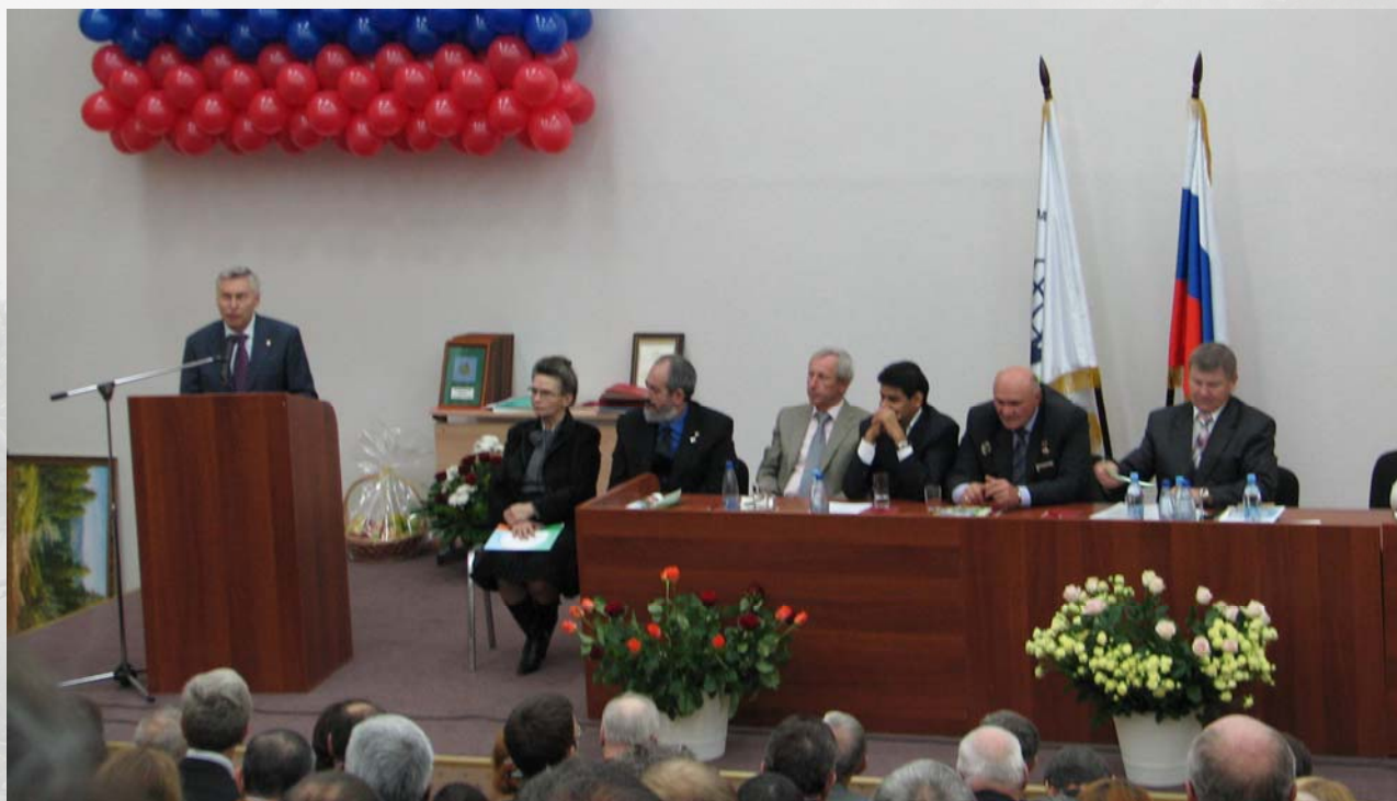
Фото.4. Торжественное заседание, посвященное 50-летию Аграрного факультета Российского университета дружбы народов. За трибуной ректор Университета академик В.М.Филиппов