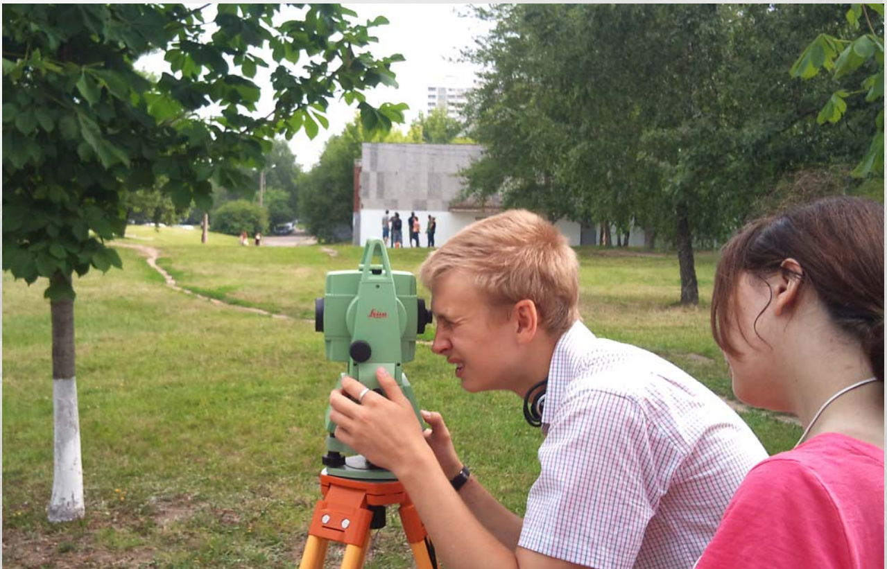
Фото 3. Геодезическая практика. Работа с электронным тахеометром