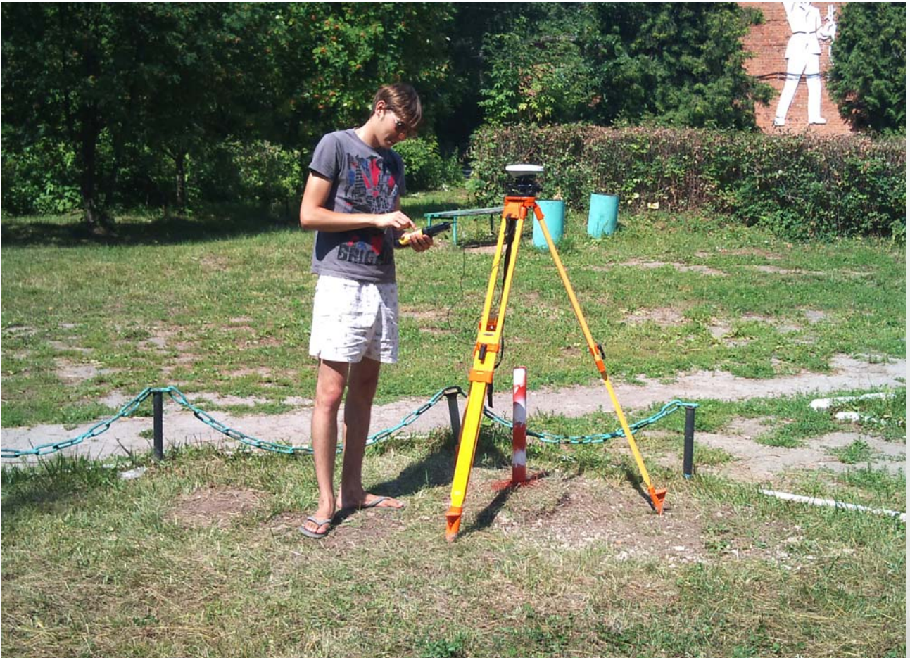
Фото 2. Геодезическая практика. Съемка спутниковым приемником