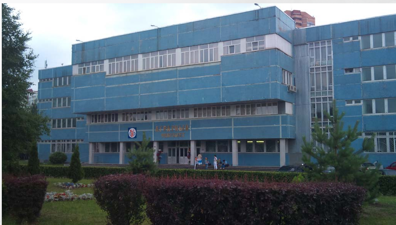
Фото. 1. Здание Аграрного факультета РУДН

В этом году Аграрный факультет отмечал свой юбилей – ему исполнилось 50 лет, а начал он свою работу 1 сентября 1961 года.